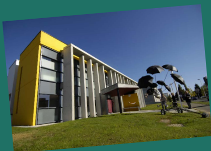
Maison des métiers de la ville